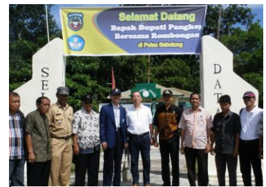
スバトゥン島の歓迎式典へ