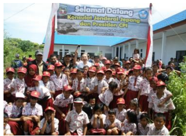
新入生になる生徒たち