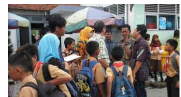
対象学校の生徒たちと…