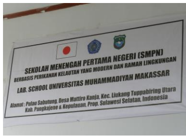
(日本の支援を謳った掲示)

C. P. I. としては、今後もこの形を推進するべく、資金の引き出しを大きくする考えである。