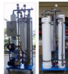
ITB で開発された装置